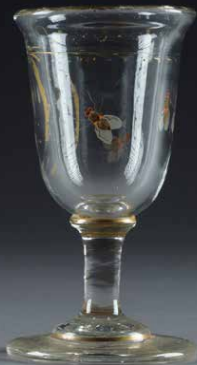
Рюмка Россия Никольско-Бахметевский хрустальный завод Конец XVIII – начало XIX века Стекло; роспись эмалями, позолота Государственный музей-заповедник «Царицыно»