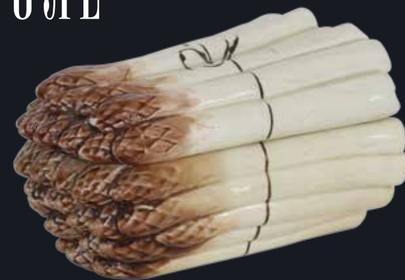
Масленка с крышкой в виде связки спаржи Россия Завод М.С. Кузнецова Конец XIX – начало XX века Фаянс; цветные глазури Государственный музей-заповедник «Усадьба Кусково XVIII века»

созданные еще в XVIII веке, например масленка в виде пучка спаржи и чашка-«роза». Конечно, такие изделия значительно уступают произведениям XVIII и первой половины XIX века в тонкости пластической отделки и мастерстве росписи, что неизбежно при изготовлении более дешевой и доступной продукции. Ассортимент предметов в жанре обманки на заводах Кузнецова был обширен: сахарницы, масленки, кувшины, фруктовницы в виде различных овощей, плодов и животных насчитывают десятки наименований.