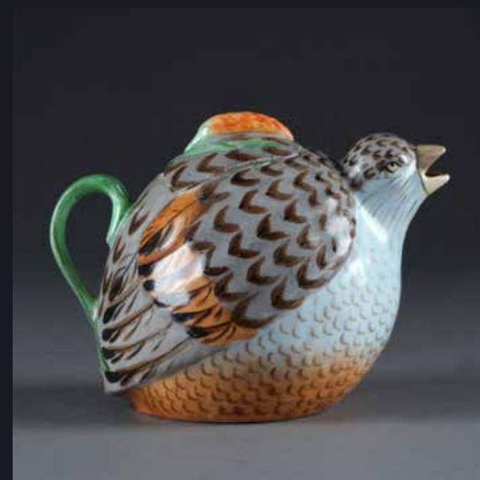
Чайник в виде перепёлки с крышкой Россия Завод М.С.Кузнецова 1890–1900-е Фарфор; роспись надглазурная Государственный музей-заповедник «Царицыно»