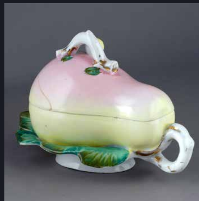
Маслёнка в виде груши Россия Завод М.С.Кузнецова Конец XIX – начало XX века Фарфор; роспись надглазурная Государственный музей-заповедник «Царицыно»

К началу XX века фарфоровые и фаянсовые обманки занимали заметное место среди массовой продукции заводов товарищества М.С. Кузнецова и предприятий И.Е. Кузнецова. На кузнецовских фабриках творчески перерабатывали для массового производства некоторые известные модели,